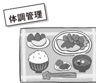
体調を整え丈夫な体を作ろう

運動会の練習も始まっています。疲れのたまる時期ですので、よりいっそう体調管理に努めてください。