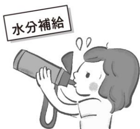
水分をこまめにのろう

5月は熱中症シーズンの始まり。急に暑い日が出てきて、暑さに慣れていない体がついていけず、熱中症になりやすい時期です。暑さに負けない体づくりをはじめましょう！