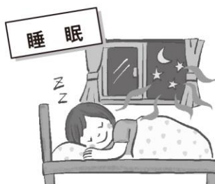
ぐっすり眠れる環境を整えよう