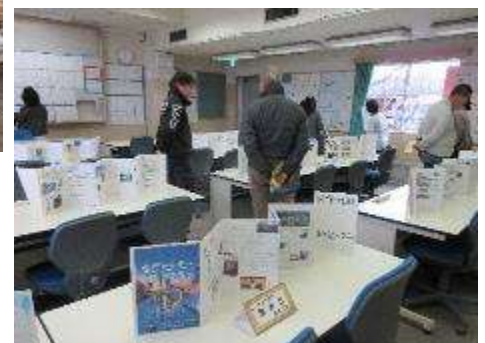
学校運営協議会も当日に行いました。