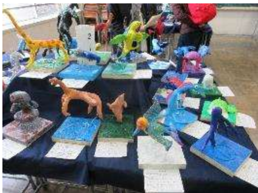
2年美術 1億年後の生き物