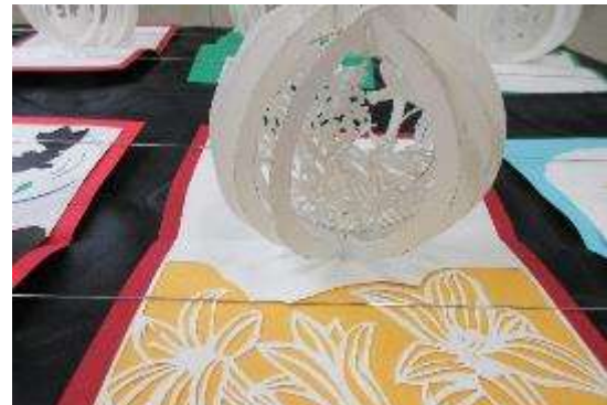
3年美術 球体ポップアップカード ～感謝の気持ちをカードに込めて～